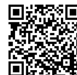
▲LEONET Wi-Fi Webサイト

学内のほぼ全ての施設内がWi-Fi利用可能エリアです。詳細は、情報科学センターWebサイトの「在学生の皆様へ」→「学生生活を支援するサービス」→「Wi-Fi」をご確認ください。教職員の方も、同様の接続方法でご利用いただけます。