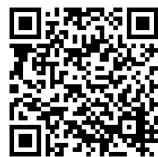
▲LEONET Wi-Fi Webサイト

学内のほぼ全ての施設内がWi-Fi利用可能エリアです。詳細は、情報科学センターWebサイトの「在学生の皆様へ」→「学生生活を支援するサービス」→「Wi-Fi」をご確認ください。教職員の方も、同様の接続方法でご利用いただけます。