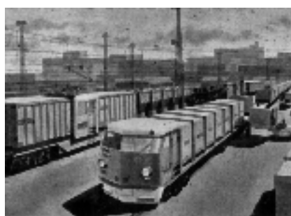
図1 新幹線用貨物電車の予想図 3) 利と考えられる。

東海道新幹線建設時の構想では、鉄道用5トンコンテナ150個を図1のような状態で積載することを想定していたようである。だが、技術的検討段階ですでにすれ違い時の風圧の影響が課題となっており 2) 、結局解決されないまま現在に至っている。仏TGVの郵便列車では、旅客用車両とほぼ同構造の車両を用いてこの課題が解決されているようであり、旅客列車と同じ速度で走行できる。さらに、TGV-Duplex用の2階建ての車両を利用した貨物列車構想もある 1) 。このことより、わが国